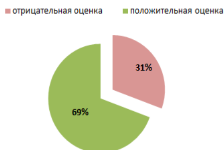
Количество подготовленных заключений об ОРВ в апреле 2017 г. (по результатам оценок)